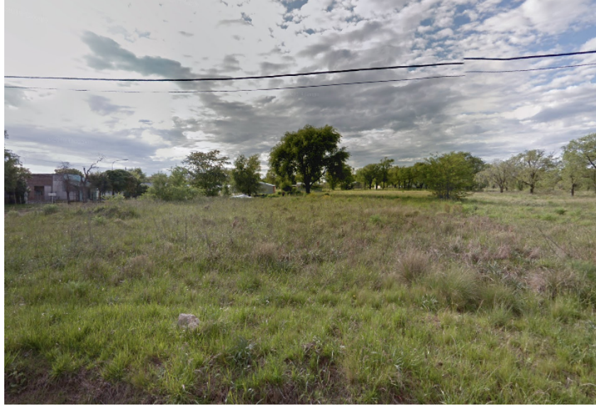
Vista desde Calle Santa Fe