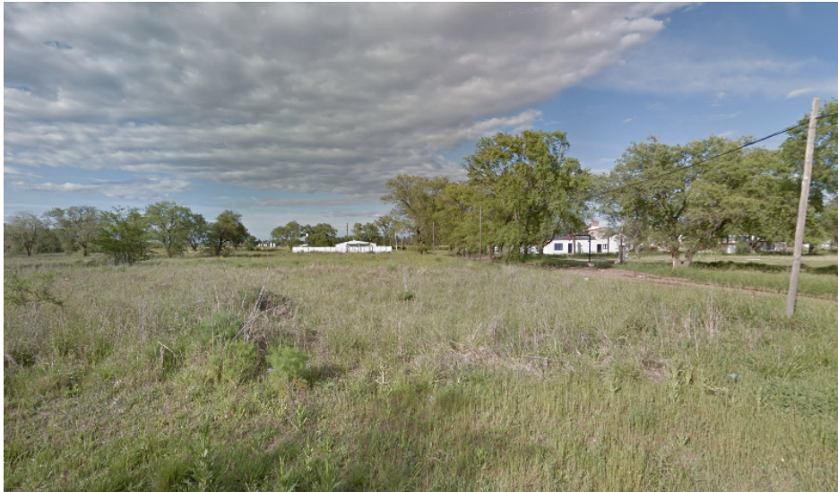
Vista desde Calle Río Negro