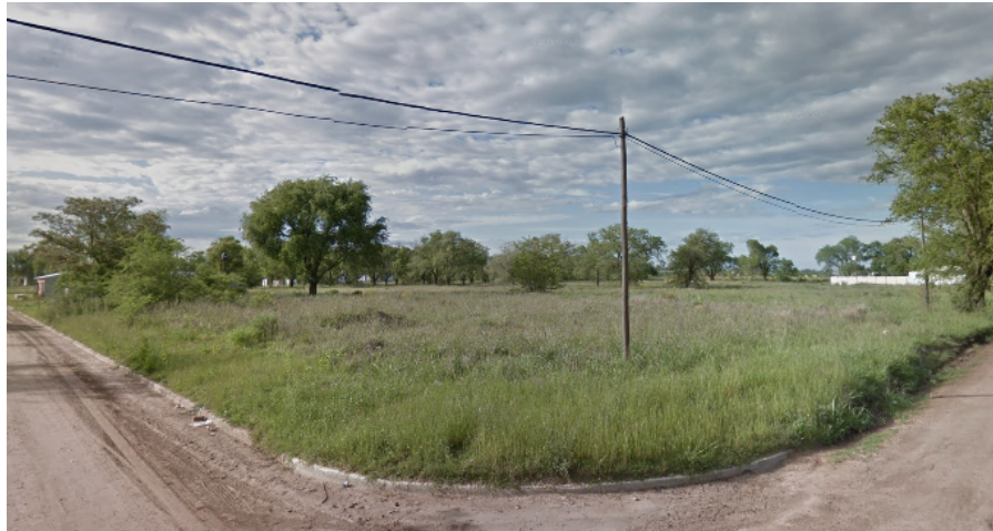
Vista desde la intersección entre Calle Santa Fe y Calle Río Negro